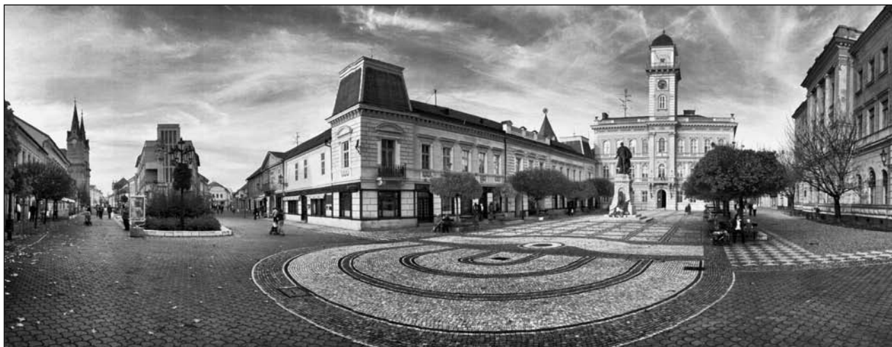
Peter Maděránek: Komárno (Slovenské mestá v panorámach)