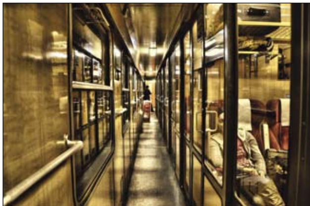
Vladimír Domen: Dlhá cesta