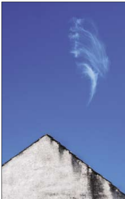
Ľubo Košian: Ticho (Závoj)