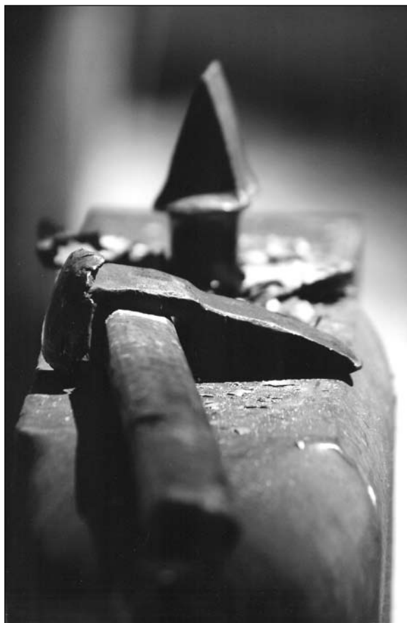
Ludovít Sabo: Tvrdá práca