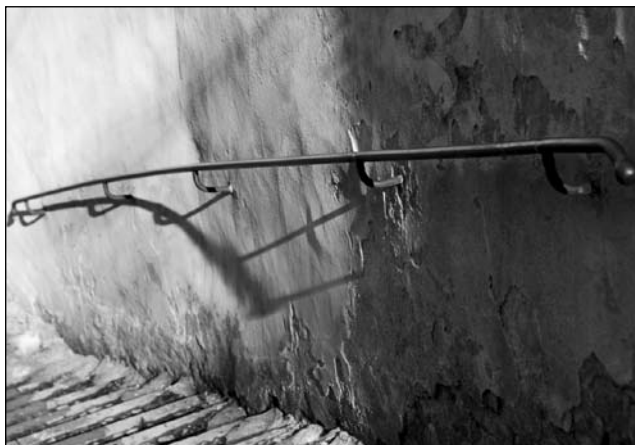
Ľubo Košian: Madlo